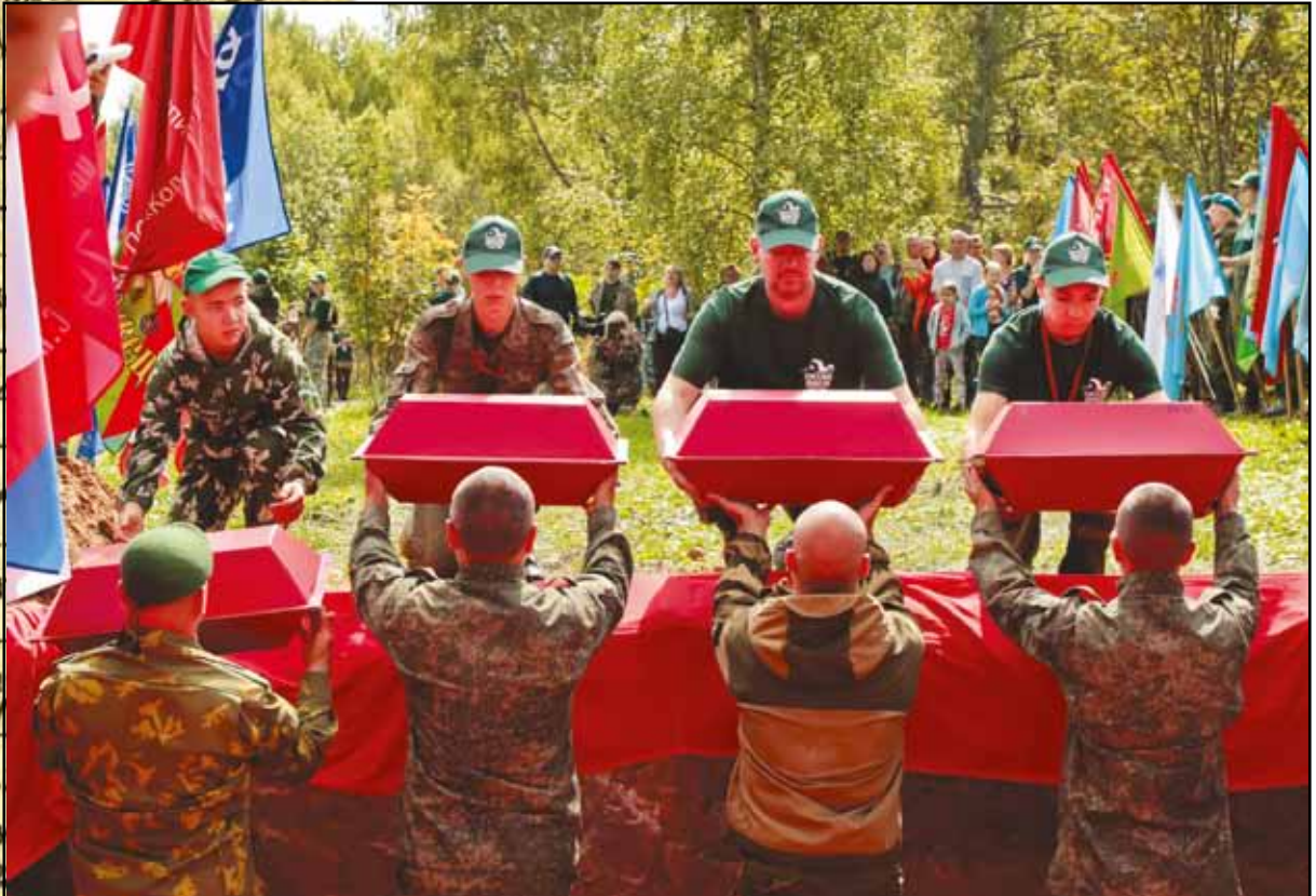
Церемония захоронения останков красноармейцев, найденных в ходе экспедиции «Западный фронт. Варшавское шоссе». Воинский мемориал «Подрыв» у д.Цветовка Барятинского района Калужской области. 23.8.2021.