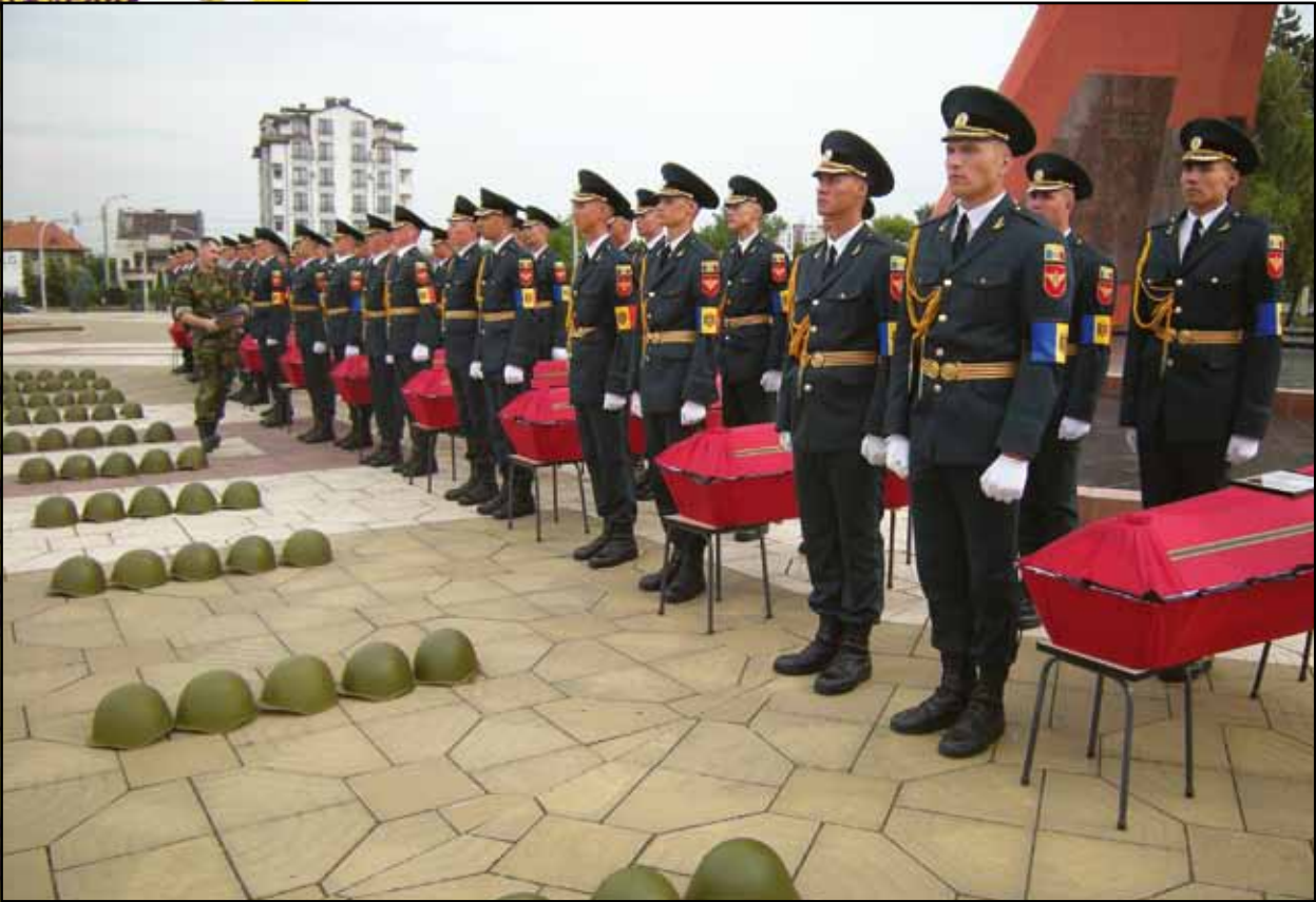
Церемония захоронения останков 62 красноармейцев, погибших в 1941 году при обороне Кишинева. Молдавия, г.Кишинев, мемориал воинской славы «Вечность». 21.6.2017.

Республика _____ Край _____ Область _____ Город _____ Район _____ С/совет _____ Каким РВК мобилизован _____ Группа крови _____