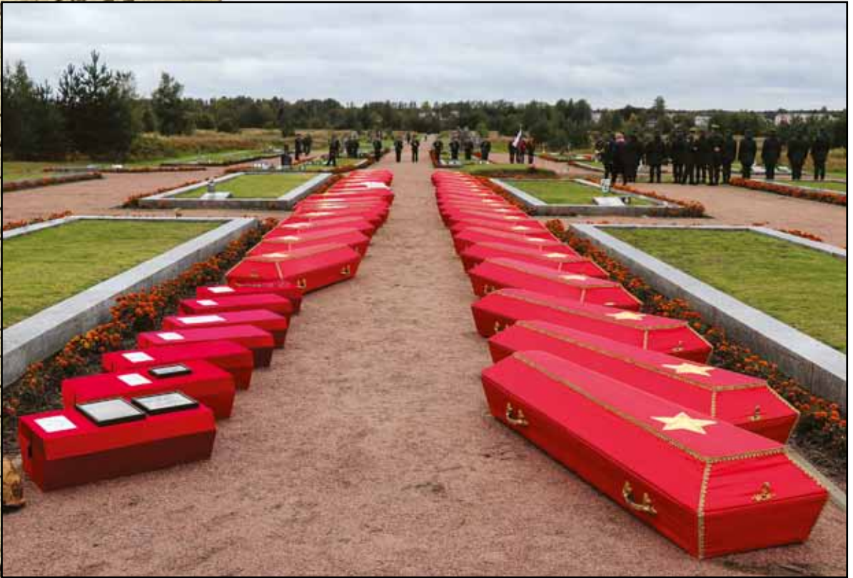
Захоронение останков найденных воинов на мемориале «Невский пятачок» в Кировском районе Ленинградской области. 18.09.2020.

Год рождения _____ Урожай _____ Республика _____ Край Ленинградский Область _____ Город Волосов Район _____ Село _____ Деревня _____ Адрес _____ Фамилия _____ Республика _____