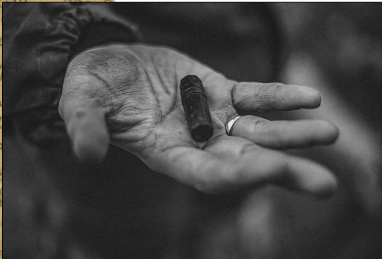
Фото Ирины Кутышевой, Межрегиональная поисковая экспедиция «Любань», 2020 г.

«А в ней хранили память медальоны, Как душ солдатских отражённый свет».