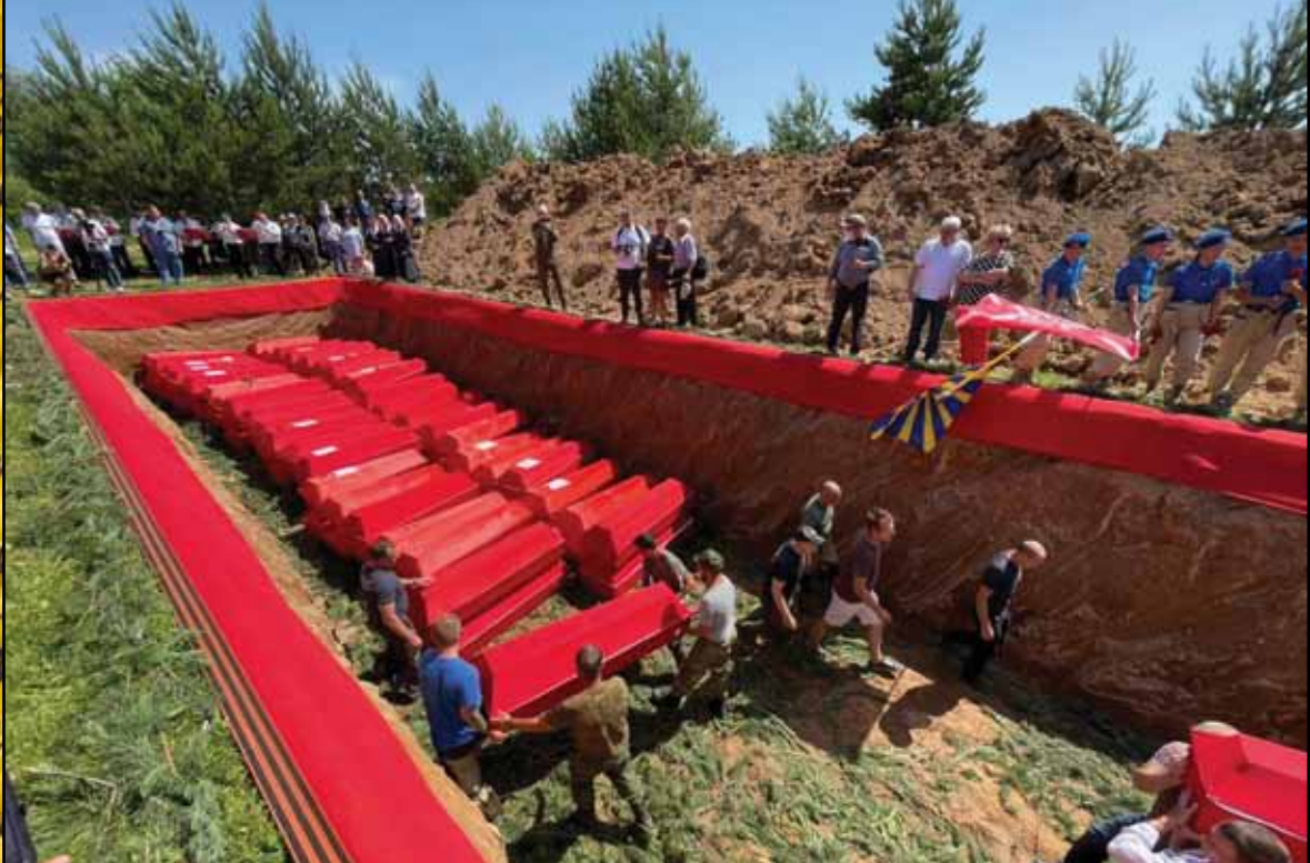
Церемония захоронения останков воинов, погибших в Ржевской битве. г.Ржев, мемориальное кладбище советских воинов. 22.6.2021.