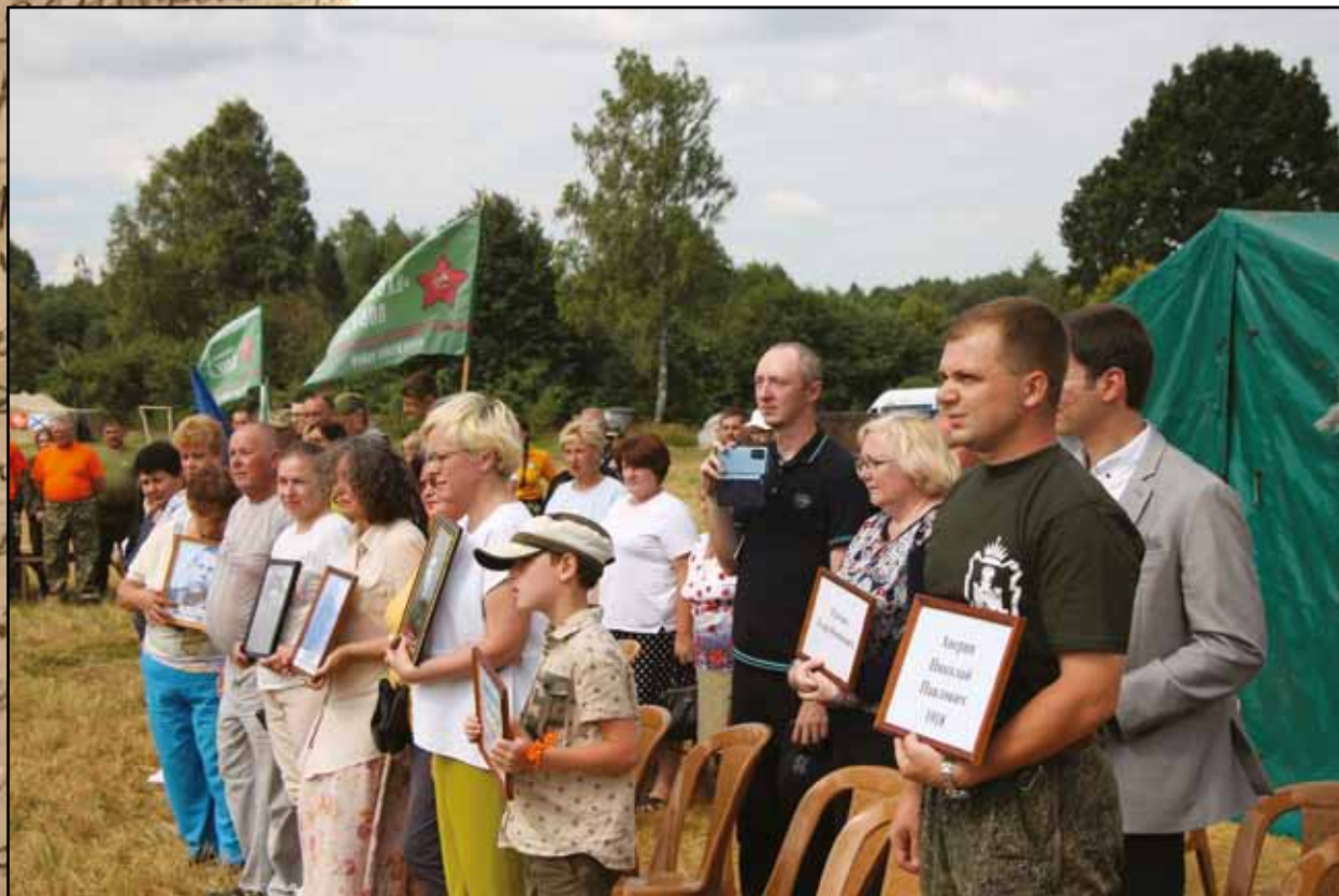
Родственники найденных воинов на церемонии захоронения. 24-я Международная учебно-тренировочная Вахта Памяти. Смоленская область. 20.8.2022.

адреса семьи область Воронежская Город Барышевское д.с.с. Тазарина д. 180, кв. 8 Теплая Кв. 14