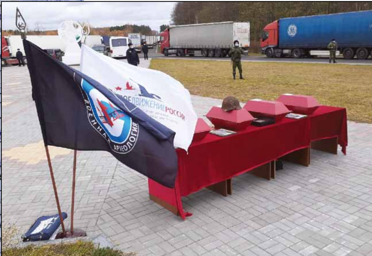
Передача останков воинов Красной армии, найденных при поисковых работах на территории России и Украины. Пограничный переход Новые Юрковичи – Сеньковка (у монумента «Три сестры» на стыке границ Белоруссии, России и Украины). 24.10.2021.