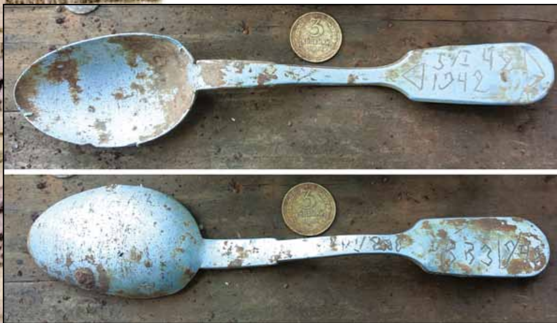
«Но что поразило на ложке солдата — Ножом нацарапанная дата». Ложка найдена при останках бойца у д.Мостки Чудовского района Новгородской области.