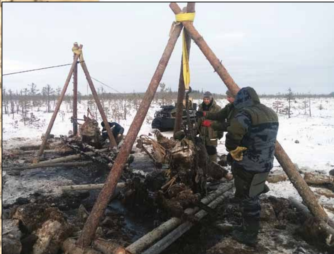
Поисковые работы на месте падения самолета Пе-2 в рамках проектов «Небо Родины» и «Крылья Татарстана». Тихвинский район Ленинградской области. Январь 2021 г.

Содержит Иванов или Иван. От. Александров Восст. 1917 Лавров Иван Александр Ураган Лавров Лавров Савин Г. Прокофьев Местность Тихвин Звезда Тихвин Тихвин Прокофьевца