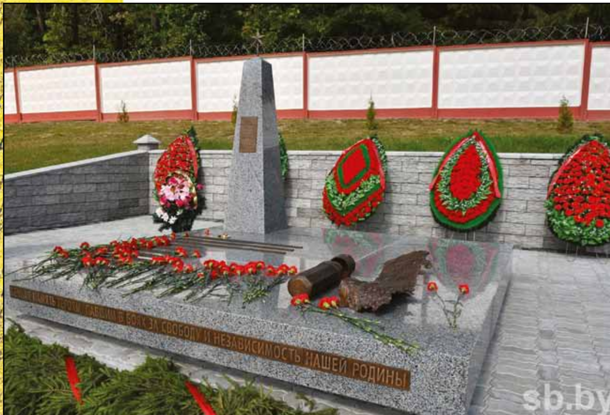
2019 г.

«Черный капсул медальона — шанс вновь оказаться дома...»