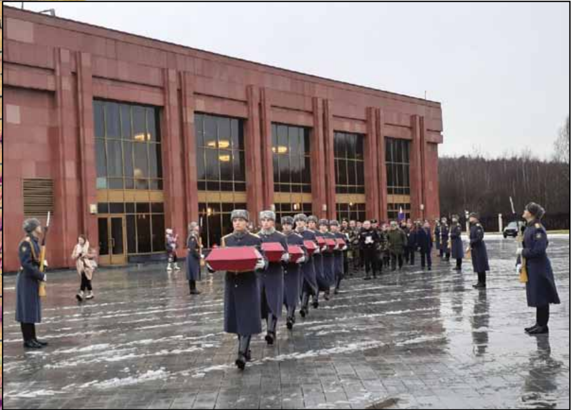
Церемония передачи останков советских воинов, павших в годы Великой Отечественной войны, для дальнейшего захоронения на малой родине. Федеральный военный мемориал «Пантеон защитников Отечества» Министерства обороны РФ. г.Мытищи. 11.11.2021.